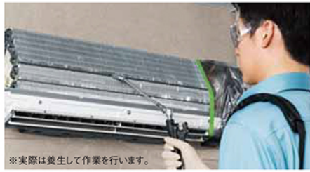
※実際は養生して作業を行います。

専用の薬剤と資器材を使った高圧洗浄で、エアコン内部まで徹底的にクリーニング。イヤなニオイの元となるカビやホコリを除去し、各部品には抗菌・防カビ処理を施します。